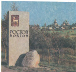
На дороге, ведущей к «пресветлому граду»

Замечательные имена вписали ростовцы в древние летописи нашего государства. По преданию, ростовская земля — родина былинного богатыря Алеши Поповича. Храбро бился с врагами Руси мужественный ростовский князь Василько весной 1238 г. на Сити во главе дружины. Раненым попал он в плен, но гордо отверг предложение перейти на сторону хана Батыя и был за это зверски замучен. Наравне с мужчинами