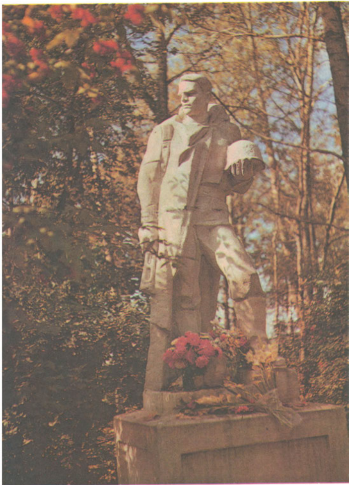
На воинском кладбище