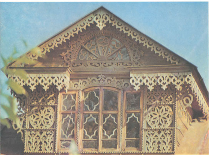
Ростовское деревянное кружево