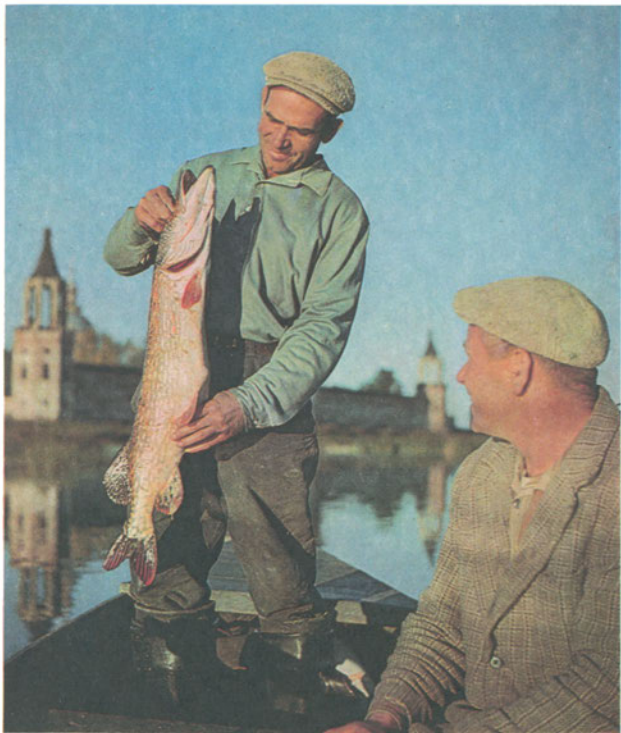
На озере Неро

вступил в строй новый железнодорожный вокзал, организовано Ростовское экскурсионное бюро, открыт ресторан «Теремок», сооружаются автовокзал, различные объекты туристского сервиса.