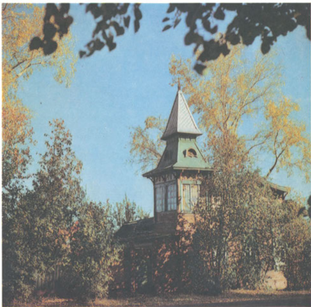
Памятник деревянной архитектуры