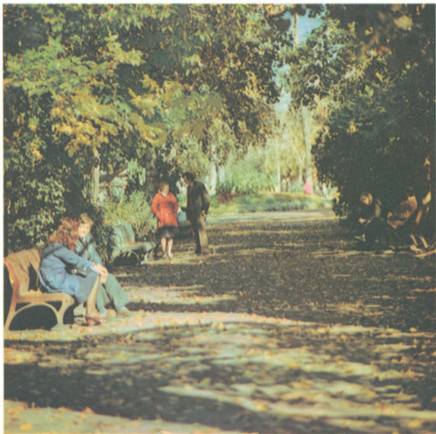
В городском парке

других предприятиях организуются забастовки в ответ на Кровавое воскресенье, в поддержку всероссийской политической стачки 1905 г. и других значительных революционных событий, происходивших в России.