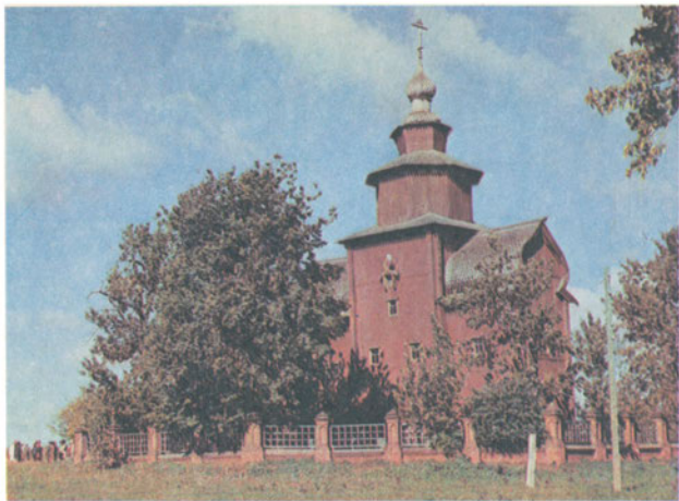
Филлал Ростовского архитектурно-художественного музея-заповедника (бывший храм Иоанна Богослова на Ишне, конец XVII в.)

Ростова Великого возрождено. И сделано это мудро, со вкусом и тактом: максимальные культурные и бытовые удобства не повлияли на атмосферу седой старины.