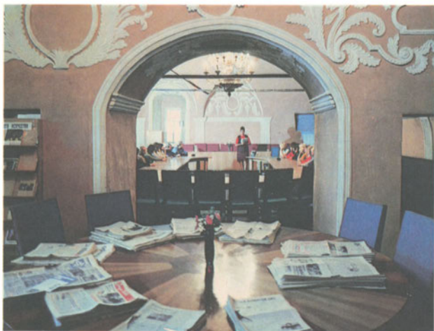
Библиотека в кремле