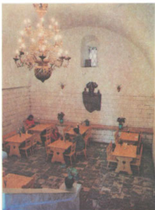
В кафе «Теремок»